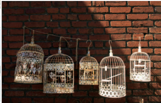
Trödelmarkt-Stilleben an der Porte de Clignancourt