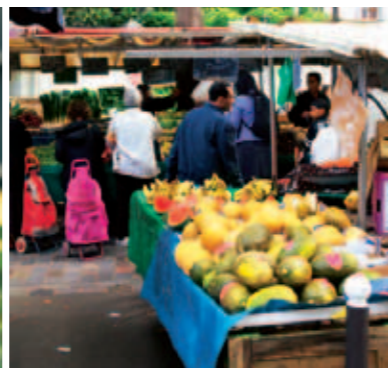
Immer wieder sonntags: der Markt an der Rue des Pyrénées