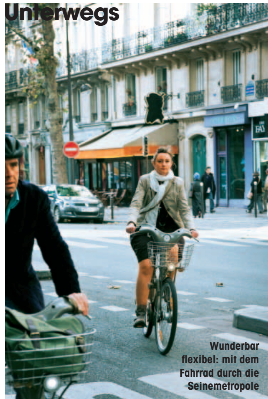
Wunderbar flexibel: mit dem Fahrrad durch die Seine metropole