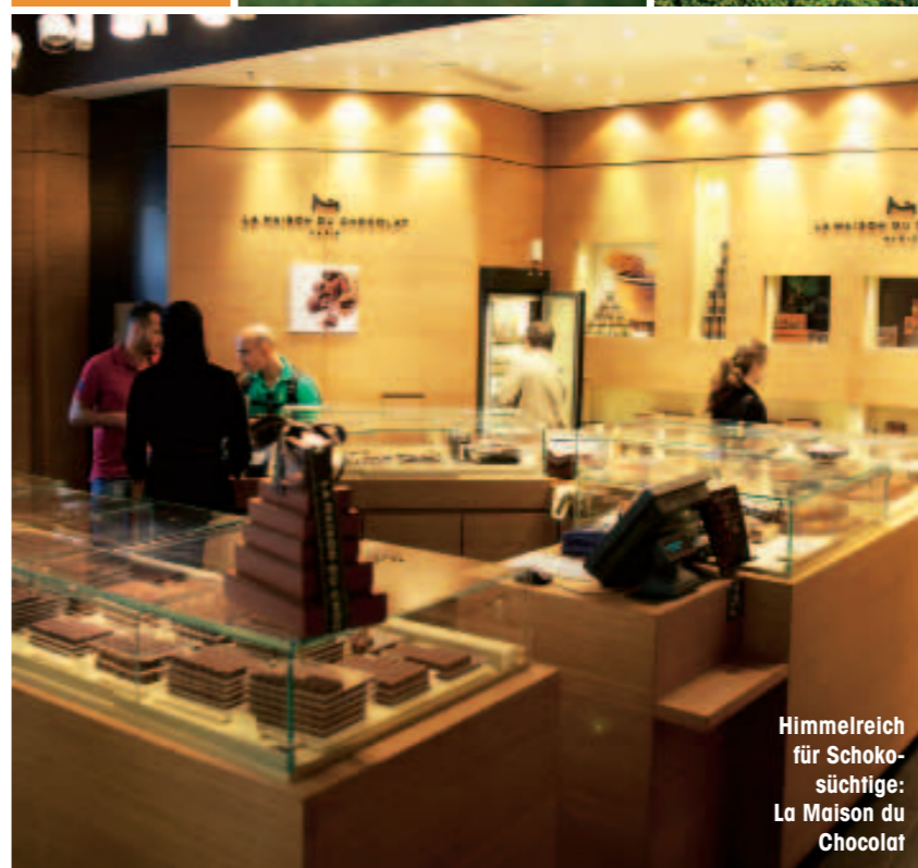
Himmelreich für Schoko-süchtige: La Maison du Chocolat