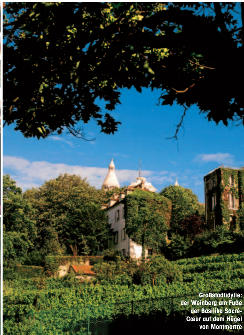
Großstadtidylle: der Weinberg am Fuße der Basilika Sacré-Cœur auf dem Hügel von Montmartre