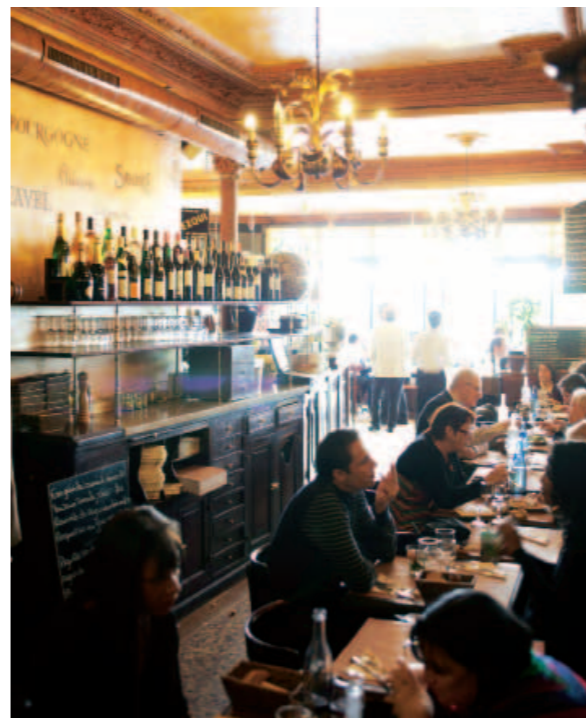
Pariser Charme: das nostalgische Bistro „Le Chantefable“