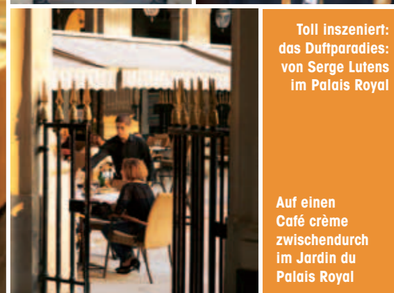
Toll inszeniert: das Duftparadies: von Serge Lutens im Palais Royal