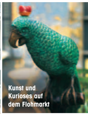
Kunst und Kurioses auf dem Flohmarkt