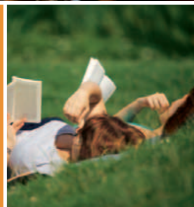
Schmökern im Grünen: Lesepause im Parc des Buttes-Chaumont