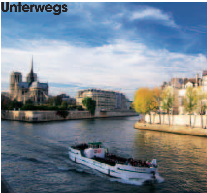
Seine-Impressionen: weiter Blick auf die Île de la Cité mit der Kirche Notre-Dame